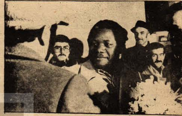
Cıvara yoldaş havaalanında

"Hiç kuşku yok ki bizim Zimbabve'deki mücadelemizin başarısı ufukta görülmüştür. Bugünkü bir askeri zaferdir. Cenevre Konferansına ancak iktidarın bize devredilmesi kabul edilirse katılabiliriz."