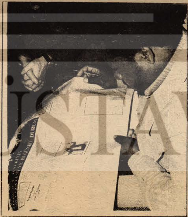
Cıvara yoldaş dergimizi incelerken

"Partimiz ZANU adına, önderimiz Robert Mugabe yoldaş adına, Zimbabve'de mücadele eden halkımız adına ve kendi adıma AYDINLIK dergisinin hazırladığı bu çok sıcak ve duygulandırıcı karşılamadan dolayı teşekkür ederim. Zimbabve'deki yoldaşlarımız ve halkımız, Türkiye'deki yoldaşlarımızın bu sıcak ilgisini duymaktan çok meranun olacaktırlar."