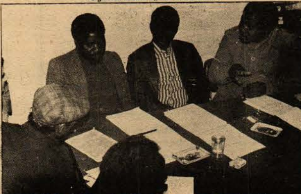
ZANU heyeti köylü arkadaşlarla

● Zimbabve'de savaş halinde bulunuyoruz. Keyfiniz öyle istediği için değil, son çare olarak savaşıyoruz.