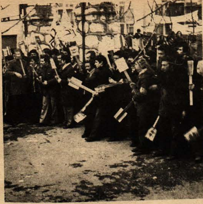
İŞTE GERÇEKLER : Barsa mitinginde TÖB-DER Genel Merkezinin görevlendirdiği İGD'li fedailer